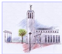
St. Johannes Nepomuk Hahn Unterm Kirchturm