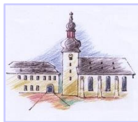
St. Ferrutus Bleidenstadt Blickpunkt