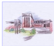
Herz Mariae Wehen Herz Mariae - aktuell