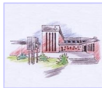
Herz Mariae Wehen Herz Mariae - aktuell