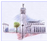
St. Johannes Nepomuk Hahn Unterm Kirchturm