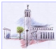
St. Johannes Nepomuk Hahn Unterm Kirchturm