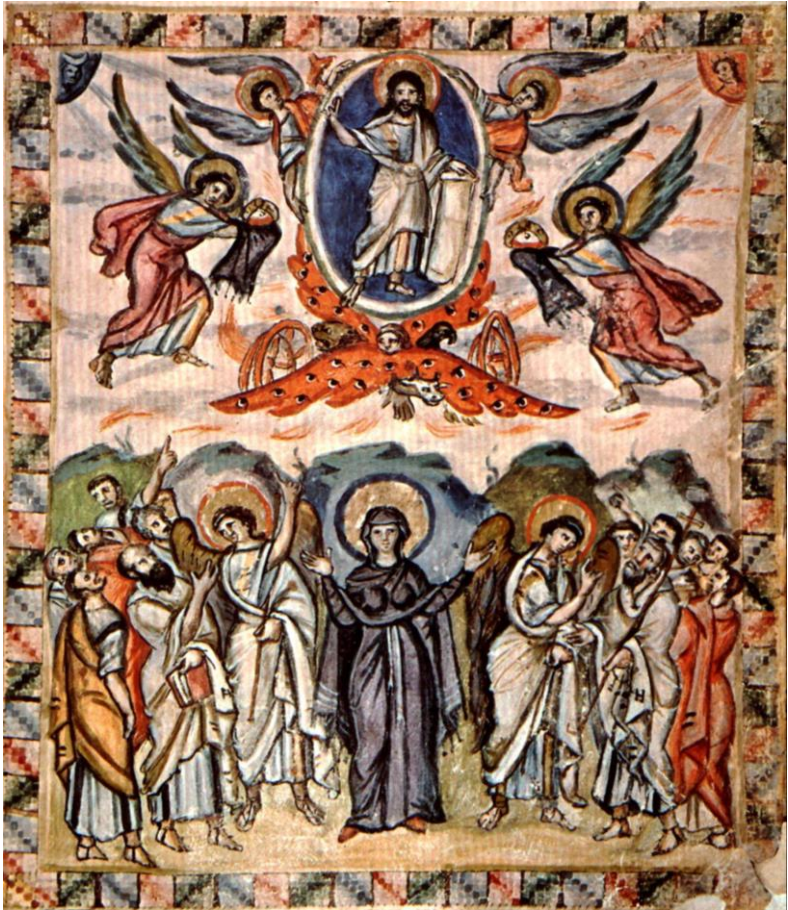
Darstellung der Himmelfahrt im Rabula-Evangeliar, 6. Jh.

Gen Himmel aufgefahren ist der Ehren König Jesus Christ. Halleluja!